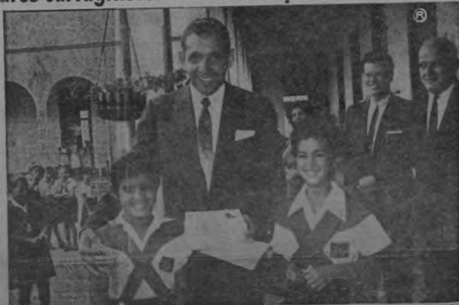
Con la espontaneidad que caracteriza los actos infantiles, estas niñas, alumnas de la Escuela Ascepción de Esquivel, de Cartago, dieron cordial bienvenida al Embajador de los Estados Unidos de América Señor Raymond Telles cuando él llegó a aquel plantel como parte de su visita oficial a la ciudad de Cartago. El Embajador señor Telles se mostró profundamente emocionado con todos los homenajes de simpatía de que fue objeto en la antigua metrópoli costarricense.