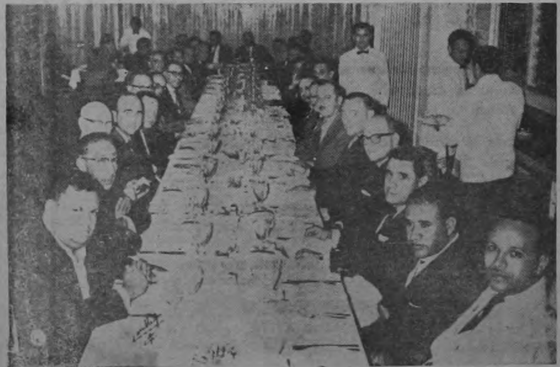
Un aspecto de la comida ofrecida el jueves en la noche por la Cooperativa de Productores de Leche en el Tennis Club a los participantes en la Reunión de la Confederación Cooperativa del Caribe que se celebra en San José.