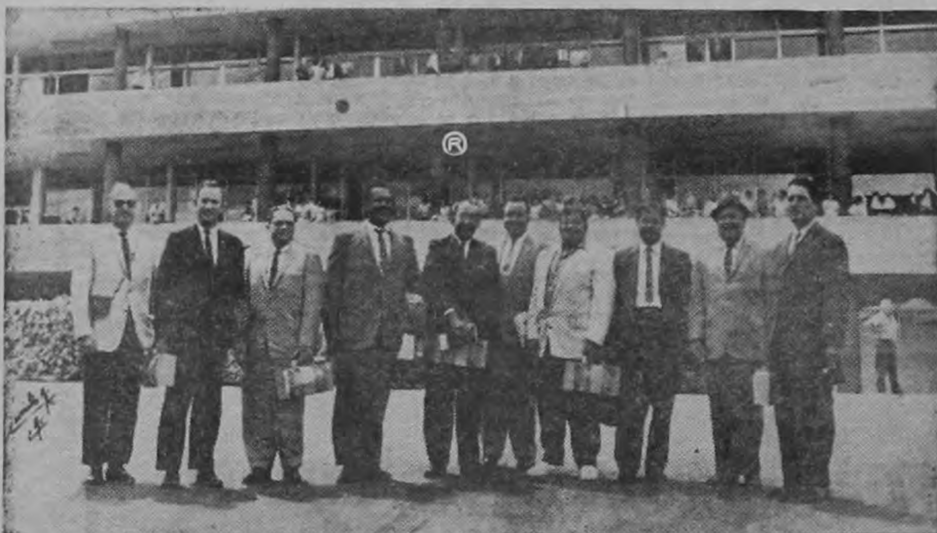
Llegada el miércoles de ganaderos de Puerto Rico que visitaron distintas instalaciones de cooperativas nacionales; Incas de ganado, lecheras etc. La delegación asiste a la Reunión del Comité Regional de la Confederación de Cooperativas del Caribe que se celebra en San José.

En la composición gráfica de Carrillo, presentamos varios aspectos de los actos que tienen lugar en nuestro país con motivo de la Reunión de la Confederación Cooperativa del Caribe. Hoy se celebra el Día Internacional del Cooperativismo.